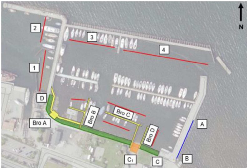
Stubbekøbing havn: Luftfoto med strækningsinddeling øst

Byrådet har ved budgetvedtagelsen for 2025-2028 afsat rådighedsbeløb på 20,750 mio. kr. til gennemførelse af projektet på Stubbekøbing Havn. Det udarbejdede prisoverslag udviser et samlet finansieringsbehov på 21,525 mio. kr. eller 775.000 kr. mere end budgetteret.