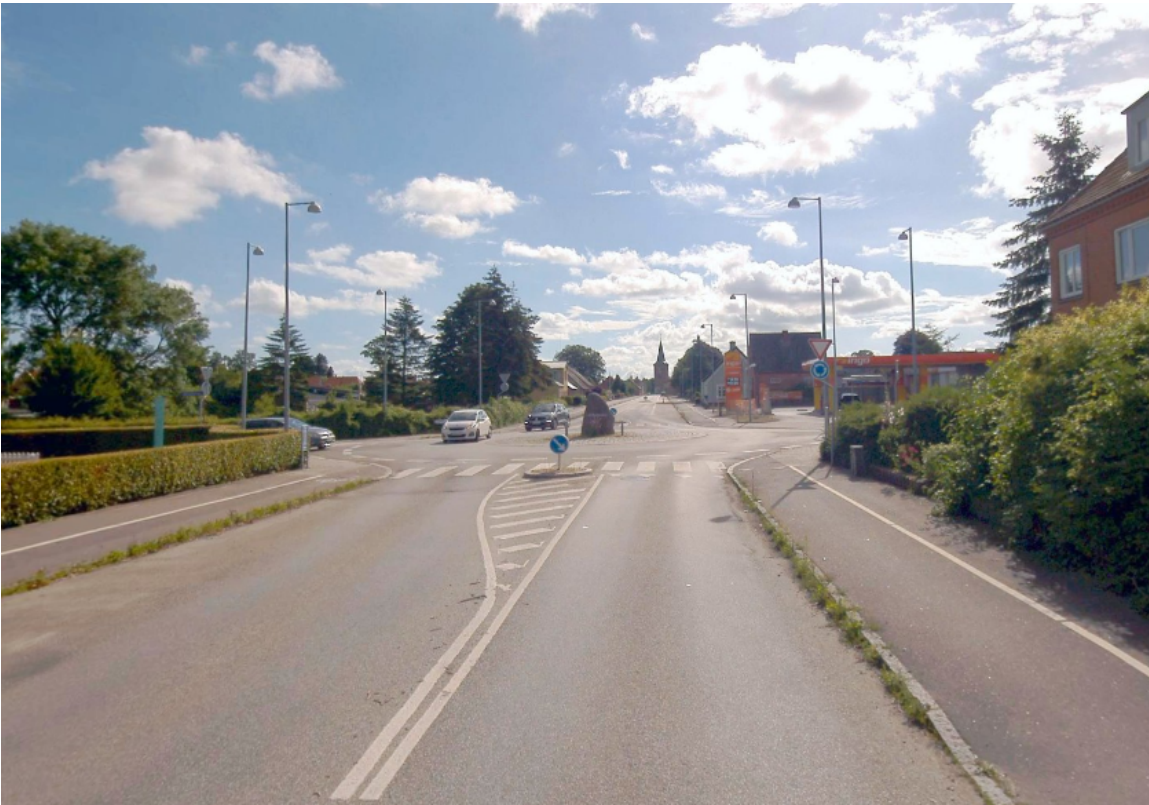
(Rundkørslen set fra Maribovej (mod øst) - 2024)