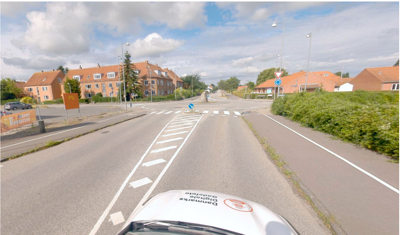
(Rundkørslen set fra Maribovej (mod vest) - 2024)