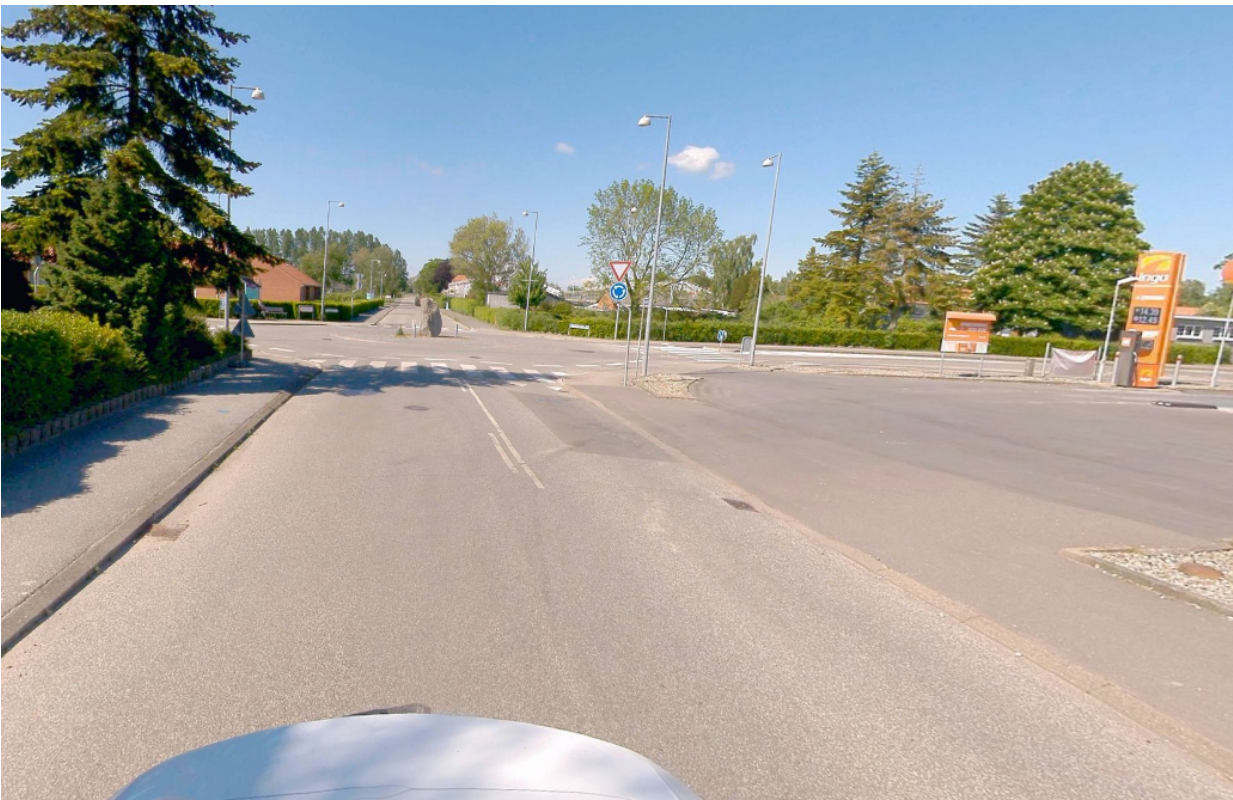
(Rundkørslen set fra Lindevej - 2024)