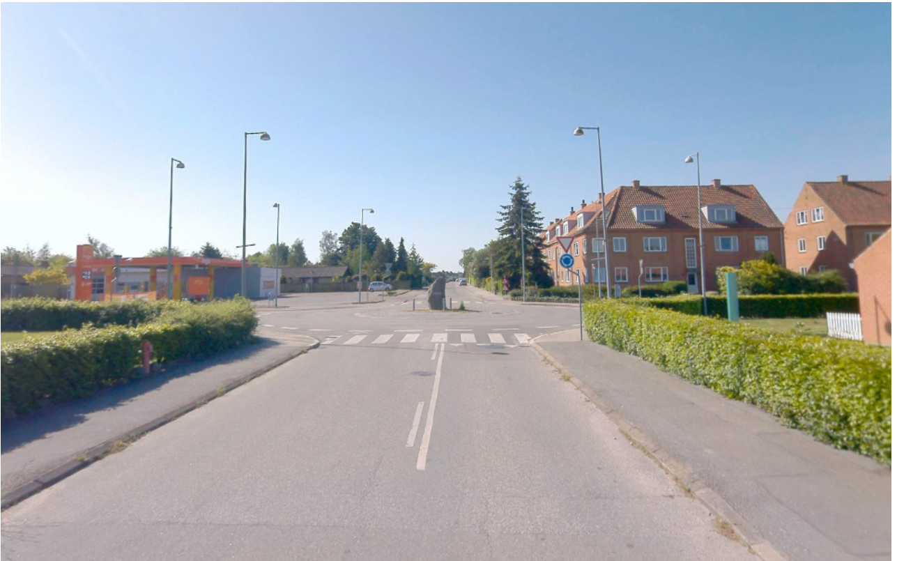
(Rundkørslen set fra Kalkbrænderivej - 2024)